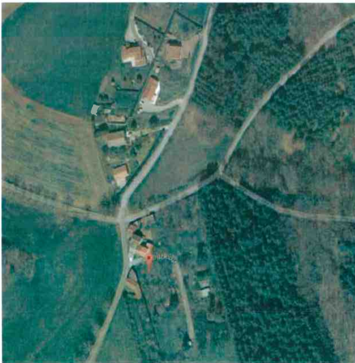
Photo village de Chabetout

Le projet de déclassement porte sur une partie du domaine public sis au village de « Chabetout » situé à l'ouest de la commune.