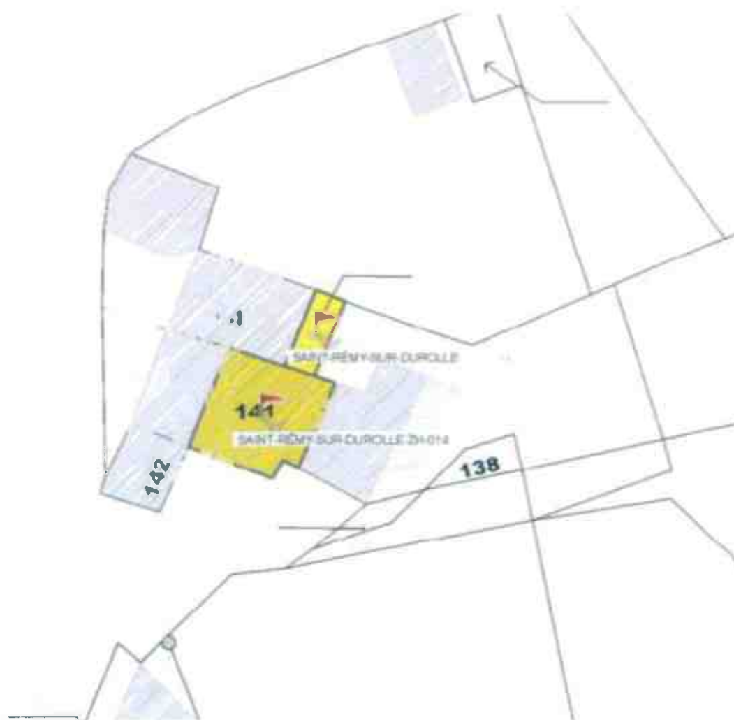
Parcelles ZH 140 et 141 (zone jaune sur le plan)